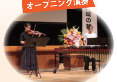
北海道ミュージック アシスト