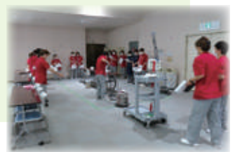
モップ作業の実技(Bグループ)