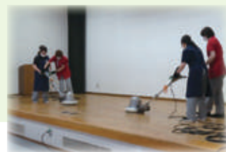
ポリッシャー作業についての指導(Aグループ)