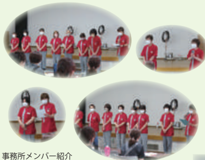
事務所メンバー紹介