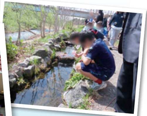
シャケの稚魚の放流